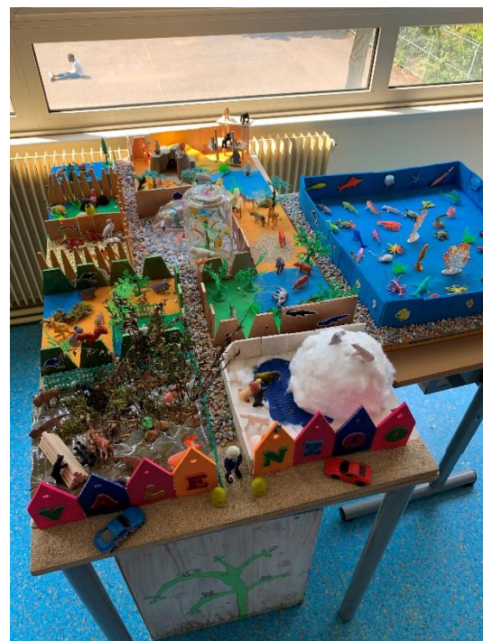
Vue d'ensemble du ValenZoo

Après avoir étudié les différentes parties du Zoo de Beauval, les élèves ont souhaité faire un zoo semblable : Volière, Savane, Désert, Amérique centrale et du sud, la banquise et un aquarium.